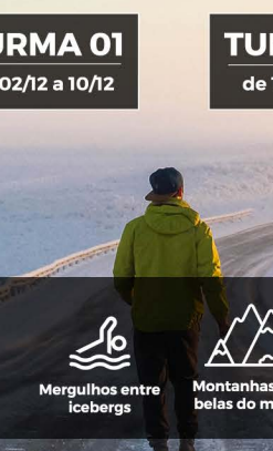
ANA POHL @anapohl

“ Fotógrafo e idealizador do "Roadtrippers" fez de uma van sua casa e abraçou a estrada. Há 5 anos intercala temporadas entre aridez de desertos, ventos congelantes do extremo sul e a vida no topo das montanhas.